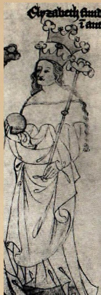
obr. Zbraslavská kronika

Čeští králové věnovali svým manželkám města, aby v nich mohly žít, až oni zemřou. Města odváděla svým královnám daně a posílala dary. Richenza získala od Václava kromě dalších měst také Hradec, dnes zvaný Králové (královnin). Podle tohoto města se Richenza nazývá také Hradecká královna.